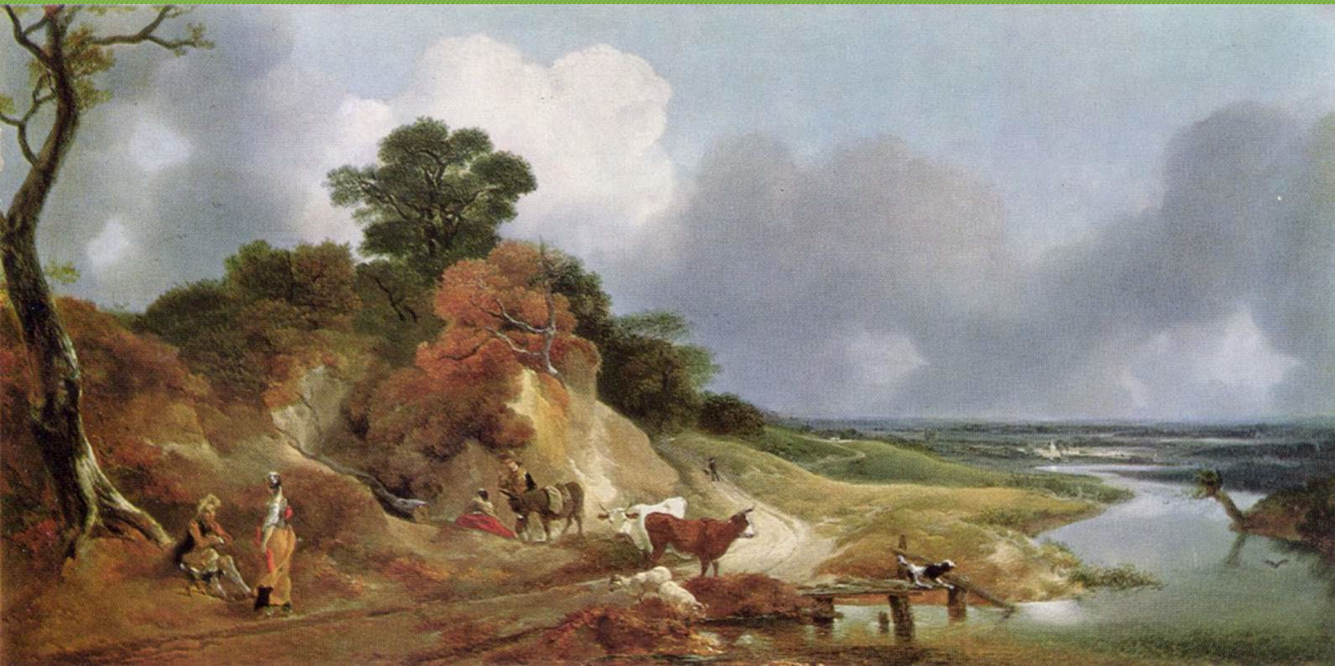
Thomas Gainsborough: "Paesaggio con vista su un Villaggio lontano" (1740-1750)