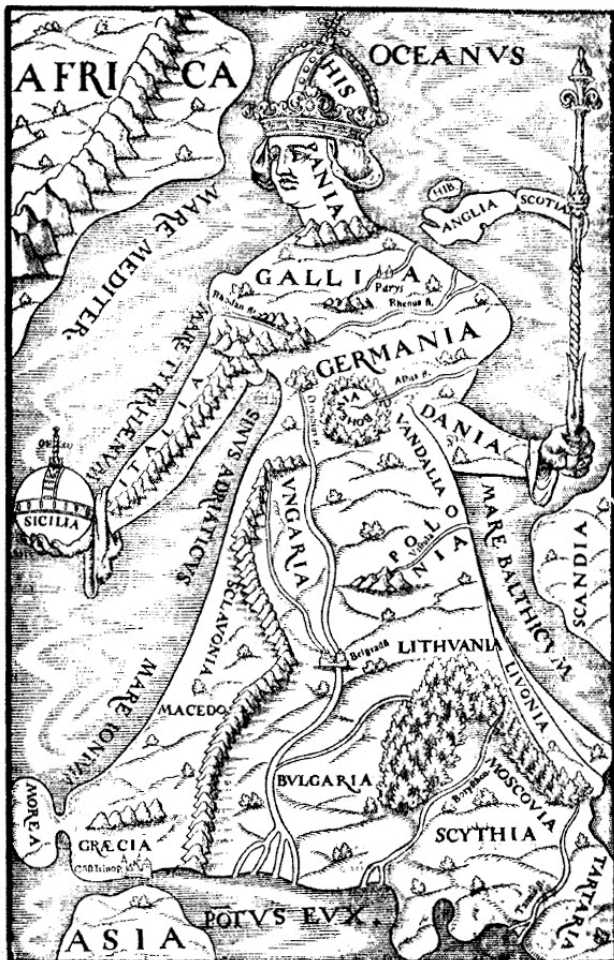
Figura 1. L'Europa regina nella Cosmographia di Münster, 1588.

ristampa tardo cinquecentesca della Cosmographia universalis di Sebastian Münster, la prima descrizione del mondo in lingua tedesca, tradotta nel corso del XVI secolo in latino, francese, italiano, inglese e ceco. Questa mappa non ha chiaramente una finalità mimetica, nella misura in cui per mimesi intendiamo la riproduzione fedele e "fattuale" di un mondo oggettivo che esiste hors-texte, fuori dalla rappresentazione stessa (Fig. 2).