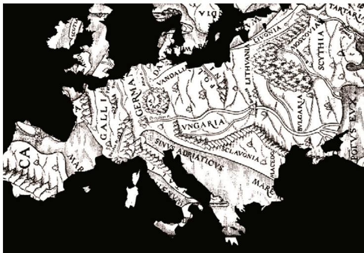
Figura 2. Sovrapposizione dell' Europa regina con una moderna mappa dell'Europa.

(e) l'epistemologia che fonda la prassi di ricerca non soltanto è esplicita, dichiarata e discussa criticamente in una misura che non ha precedenti (prima discontinuità); ma si nutre programmaticamente del pen-