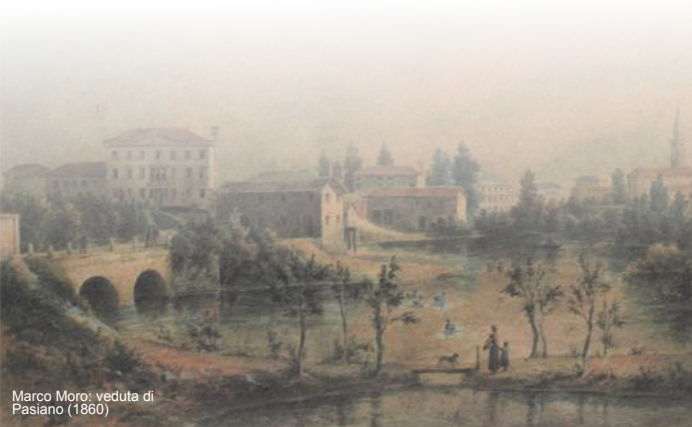
Marco Moro: veduta di Pasiano (1860)