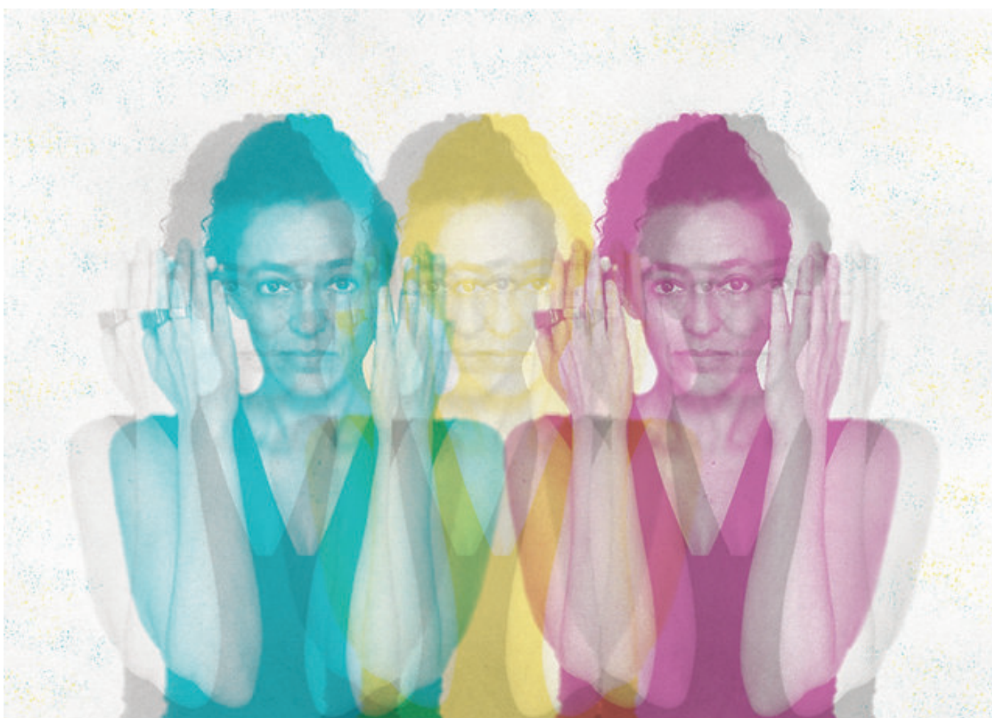
Ilustración: Renata Tesser