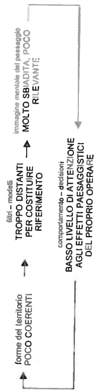
Fig. 6 - La relazione ciclica tra i modi in cui il paesaggio è percepito e automaticamente e le modalità attraverso cui le forme del territorio vengono costruite e modificate, applicata a quanto emerge dalla ricerca nella città diffusa.

La "crisi", pertanto, si situa nello scarto constatato o provato dal soggetto tra la percezione e il modello di riferimento (Lynch, 1995, p. 9). Tale scarto non permetterebbe dunque a chi abita nella città diffusa di riconoscersi: l'approccio "an-estetico" nasce forse dal fatto che non avendo i riferimenti per dare un nome agli stimoli, gli stimoli stessi non vengono percepiti e compresi. Gli sguardi che si pongono come esterni, invece, vivono con malessere la distanza dai modelli, poiché ne sono forse maggiormente consapevoli.