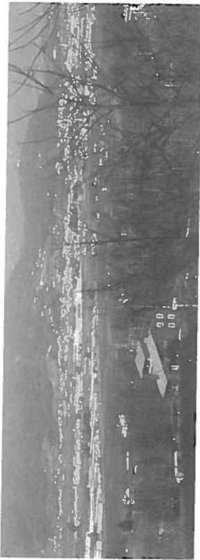
Fig. 4 - La città diffusa pedemontana vista dal Montello.

occupato da un campo sportivo e dalle scuole dell'infanzia e primaria, gli abitanti riferiscono che si sta progettando di costruire la piazza di Campagnalta.