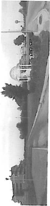
Fig. 3 - Il nuovo centro di Vigorovea, con il capitello e la piazza (sulla destra nella foto).

La frazione di Biadene afferisce al Comune di Montebelluna (TV), capoluogo di quel distretto della calzatura sportiva che contraddistingue l'area pedemontana veneta ai piedi del colle del Montello. Storicamente legata alla presenza di una vasta proprietà agricola il cui centro era rappresentato da una villa nobiliare, è prodotto di una crescita incrementale soprattutto legata all'attestarsi nel suo territorio di insediamenti industriali consistenti (15), ma influenzata anche dal parallelo sviluppo urbano della vicina Montebelluna, con la quale ha finito per saldarsi. Lo sviluppo edilizio ha coinvolto, grazie ad una iniziativa di edilizia convenzionata, le falde del Montello (fig. 4).