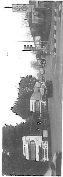
Fig. 5 - La strada Postumia a Campagnalta.

3.2. Ieri e oggi. Il cambiamento. - Le carte di fig. 2, pur riportando solo le variazioni subite dall'edificato, testimoniano la consistenza e la rapidità dei fenomeni di trasformazione territoriale nelle aree di indagine, sufficiente a far supporre l'importanza del significato del cambiamento nella percezione sociale. Per gli intervistati infatti il cambiamento economico e sociale è questione nitidamente percepita e trattata con una certa competenza anche nei suoi sviluppi più recenti.