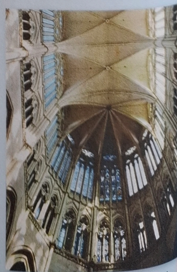
Cattedrale di Notre-Dame di Amiens, coro.