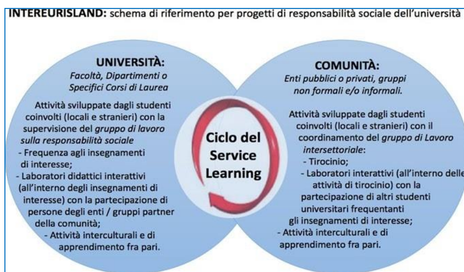
Figura 1: Schema di riferimento per progetti di responsabilità sociale dell'università (Andrian, 2018)

Il progetto di ricerca-azione e formazione INTEREURISLAND 1 viene proposto e realizzato per sviluppare i vincoli fra il mondo accademico e la comunità attraverso uno scambio e un dialogo alla pari, nell'ottica della Terza Missione dell'università.