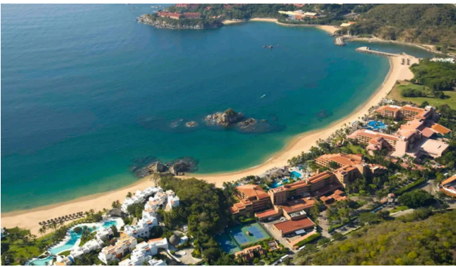
CONSEJO DE CUENCA DE LA COSTA DE OAXACA, MÉXICO Y SUS ORGANOS AUXILIARES