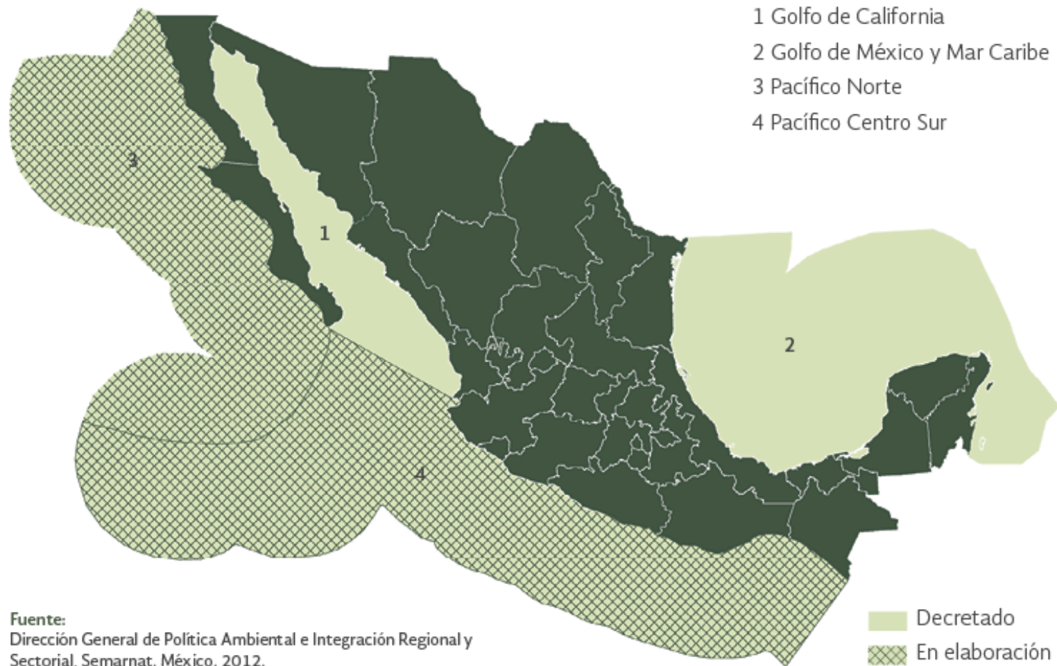
Mapa a | Ordenamientos ecológicos marinos