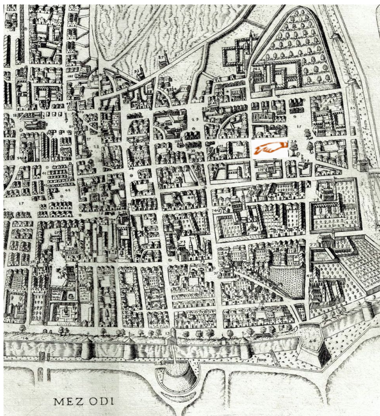
Il monastero del S. Spirito al n. 120, nella mappa del Rascicotti del 1599. S. Maria in Calchera al n. 119. Piazza T. Brusato al n. 15