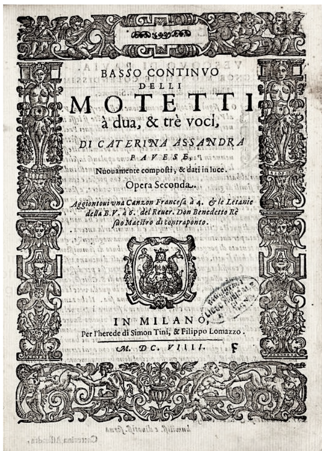
Civico Museo Bibliografico Musicale di Bologna