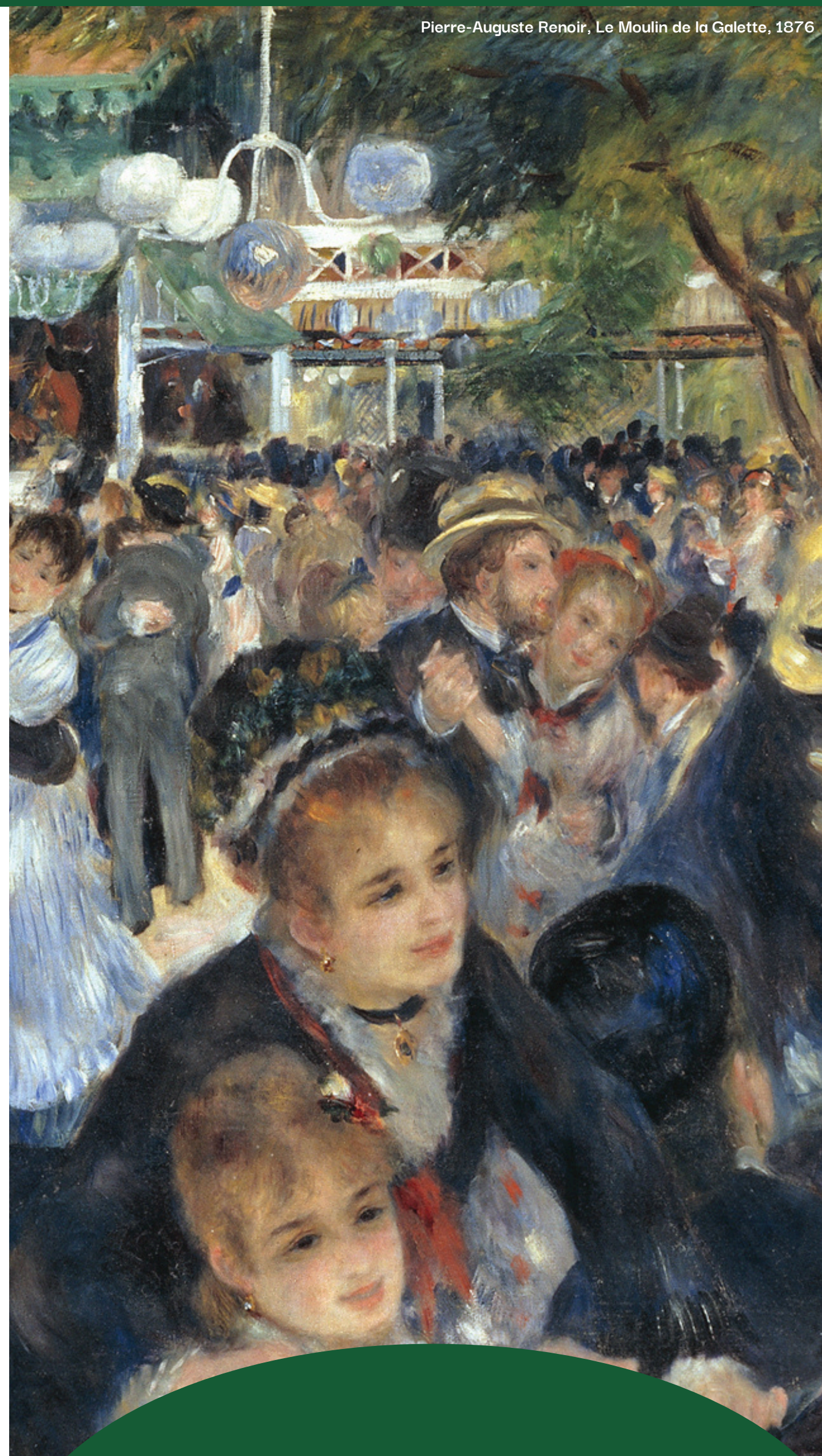
Pierre-Auguste Renoir, Le Moulin de la Galette, 1876

Ciclo di incontri nella forma di talk su libri e linee di ricerca sulla musica in prospettiva interdisciplinare: musicologi, storici e filosofi del mondo antico, storici dell'arte e psicologi cognitivisti dialogano insieme su tematiche attuali di ricerca tra peculiarità, curiosità e rivelazioni.