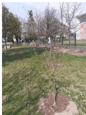
piccolo frutteto didattico