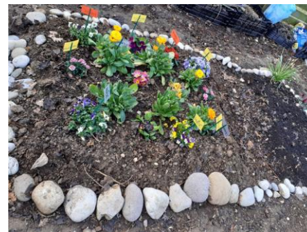
la nostra aiuola dei fiori per le farfalle e gli insetti impollinatori