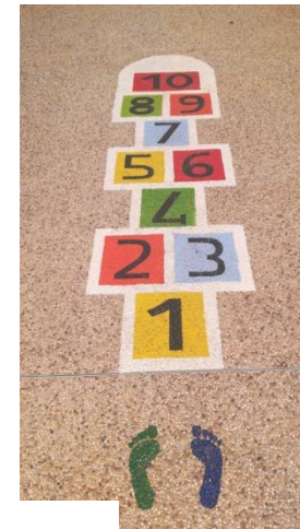
giochi orizzontali matematici

segnaletica orizzontale nel tratto casa-scuola come indicato nel progetto "LA ZONA SCOLASTICA DEI 15 MINUTI"