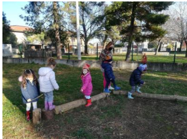
giochi di equilibrio