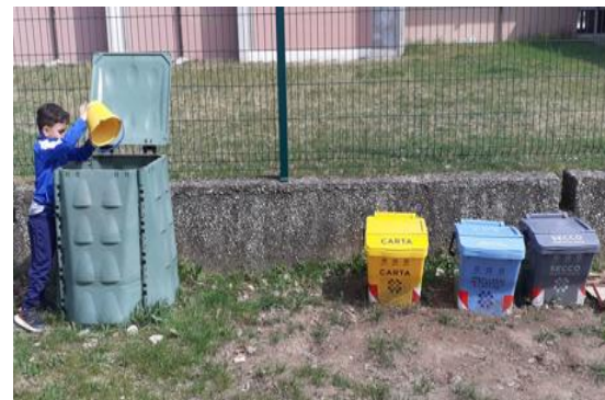
compostaggio per humus