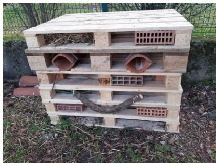
casetta degli insetti impollinatori