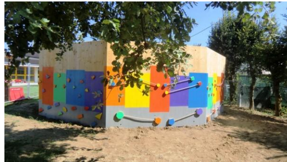
arrampicata orizzontale (da realizzare)