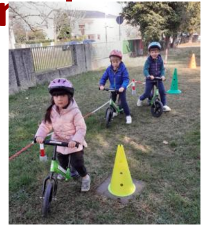
pista di balance bike