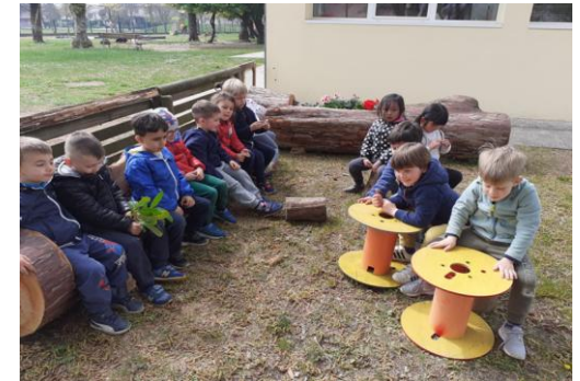
elementi naturali per panche