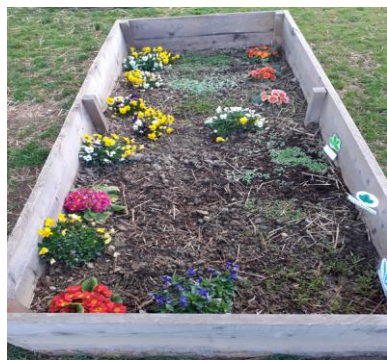
il nostro primo orto didattico