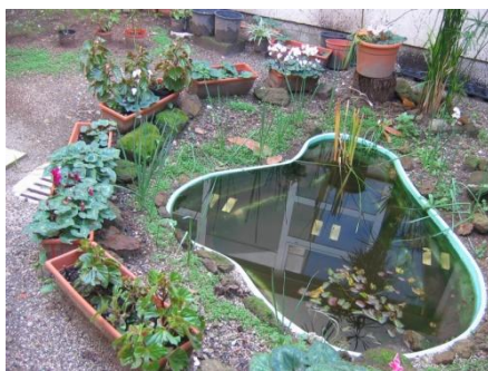
piccolo stagno da realizzare il prossimo anno